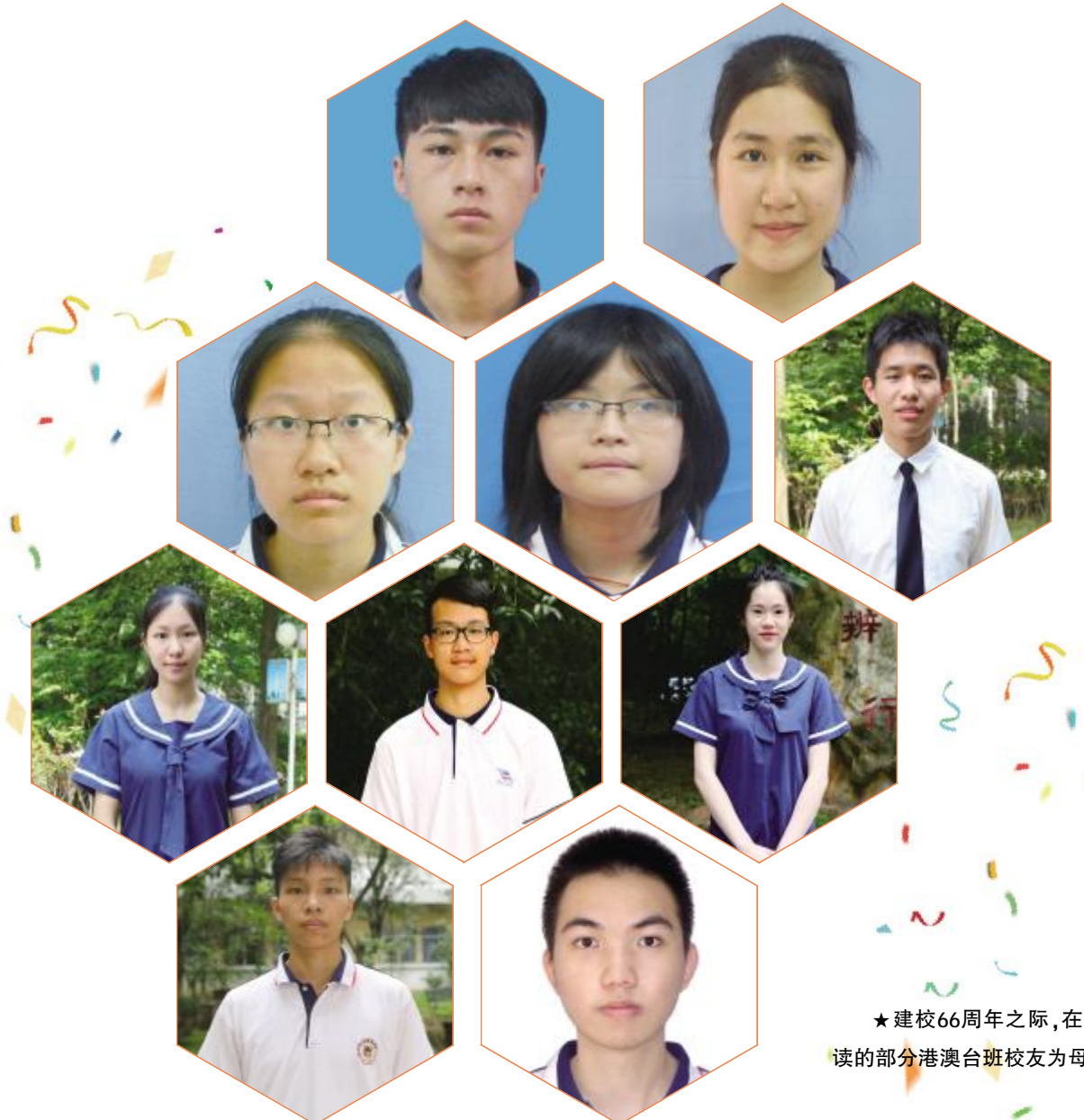
★建校66周年之际，在清华、北大就读的部分港澳台校友为母校送来祝福